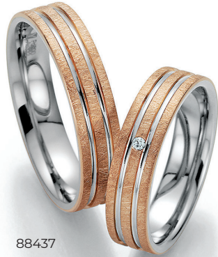
88437 Traces of Life