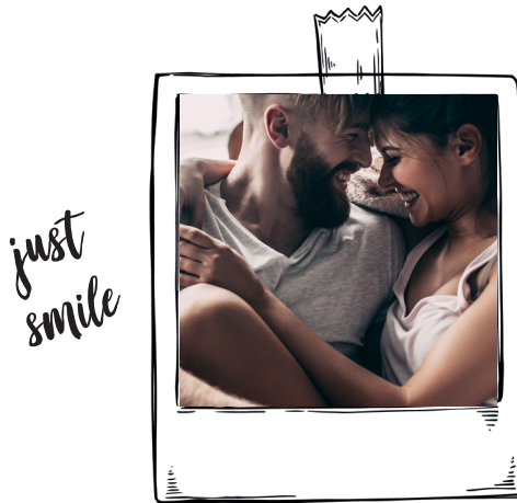
Titelring: 88457 Passion

Aufgrund der Anlaufbeständigkeit wurde Platin zum bevorzugten Metall für Juwelenschmuck. Diamanten kommen in der farbneutralen grau-weißen Fassung voll zur Geltung sowie Farbe und Glanz bleiben unverändert erhalten. Kurz um: Platin ist in Bezug auf Eheringe ein Werkstoff, der viele Wünsche erfüllen kann – möglicherweise ja auch exakt diejenigen, die Dir und Deinem Partner am Herzen liegen!