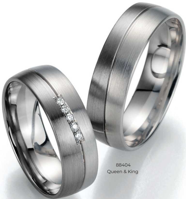
88404 Queen & King