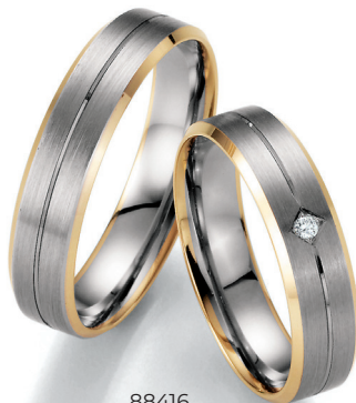
88416 Ray of Lights